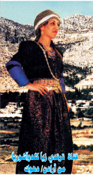
فتاة ترقص في كندواشوريا من أوران / دهوك