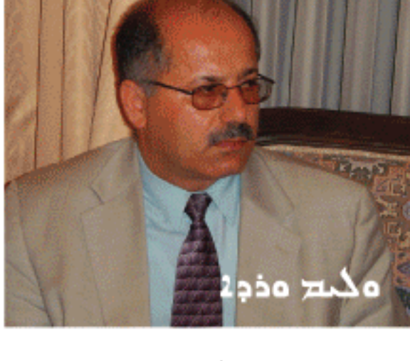
... 26 (2) ...