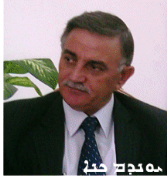
... 26 (2) ...