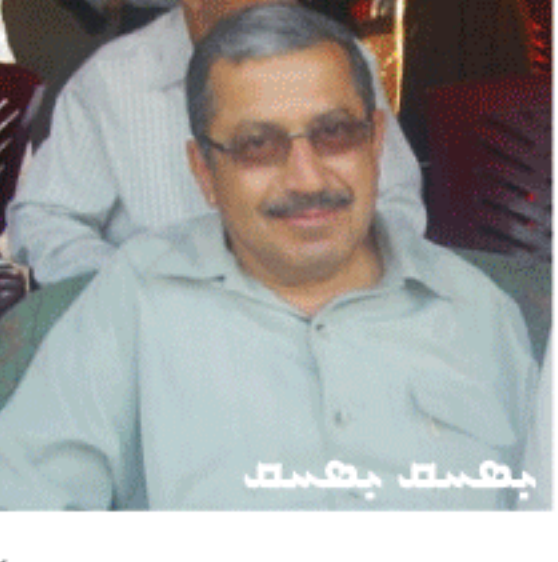
... 26 (2) ...