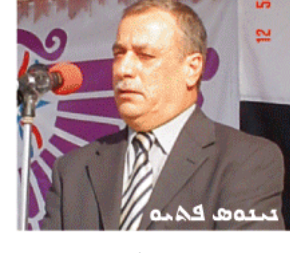
... 26 (2) ...